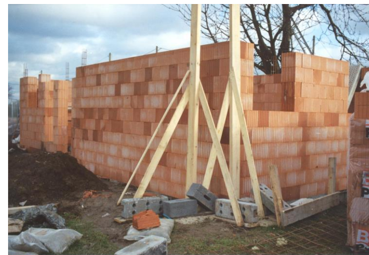
Entreprise DUJARDIN S.A.