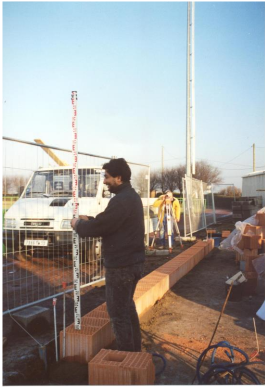
Vérification du niveau du 1 er rang