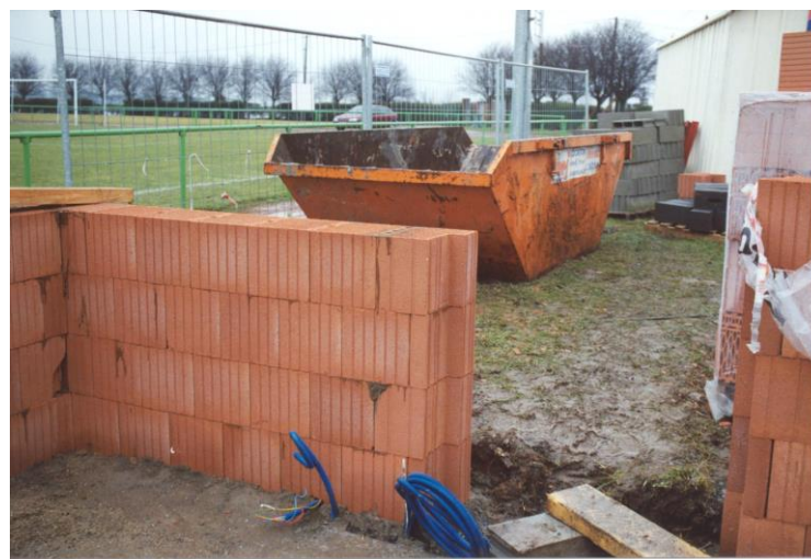
Sainghin en Weppes Briques feuillures aux portes