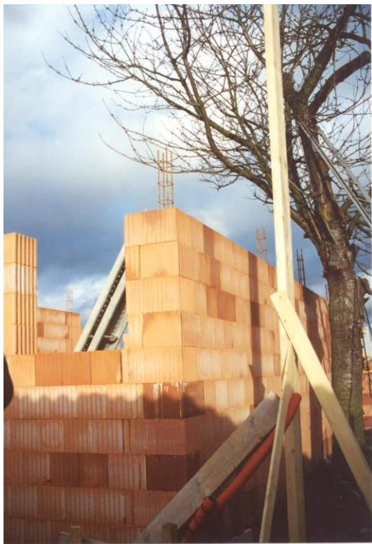
Club- House et vestiaire d'arbitres Stade Bétrancourt